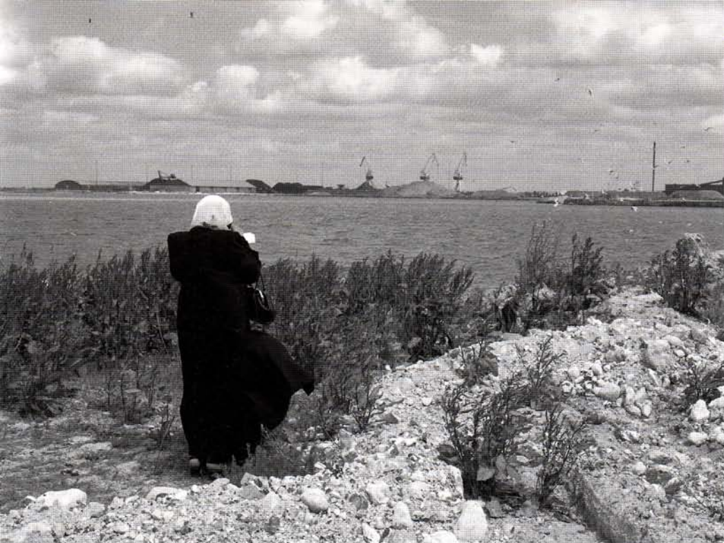
Norra hamnen i Malmö under en exkursion i projektet Natur & Retur .

från arbetet såg en kollega hur klotter sanerades från en husvägg. Väggen fotograferades av saneraren före och efter utfört uppdrag. Projektet Klotter inleddes. VD för saneringsfirman "Klottrets fiende No 1" intervjuades och ca 1000 bilder lades till samlingarna. Materialet kommer inte att visas i någon utställning, och det ska inte skrivas någon rapport. Men materialet finns bevarat och förhoppningsvis kan vi göra en kompletterande insamling om ett par år.